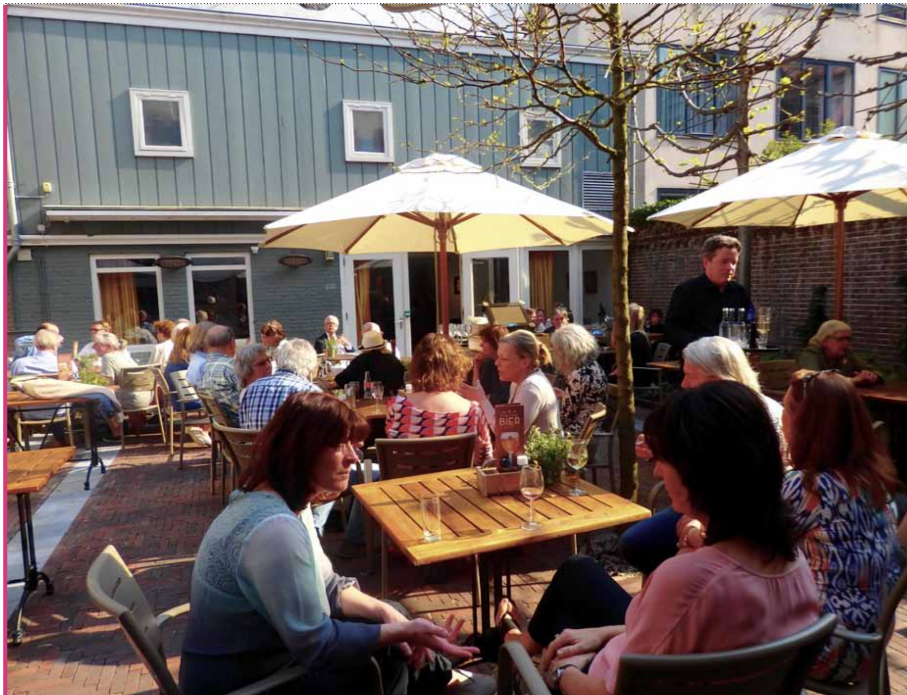
De nieuwe tuin van Pulchri Studio.